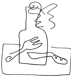
Έργα: Αλέξης Ακριθάκης 1979 ©The Estate of Alexis Akritchakis

Το κατάστημα υποχρεούται να διαθέτει έντυπα δελτία σε θήκη δίπλα στην έξοδο για τη διατύπωση οποιασδήποτε διαμαρτυρίας.