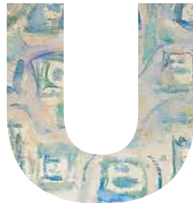
Detail: La Sortie de la Baignoire Pierre Bonnard

Το κατάστημα υποχρεούται να διαθέτει έντυπα δελτία σε θήκη δίπλα στην έξοδο για την διατύπωση οποιασδήποτε διαμαρτυρίας. Για την προετοιμασία του φαγητού χρησιμοποιούμε έξτρα παρθένο ελαιόλαδο. Για την προετοιμασία τηγανητών παρασκευών, χρησιμοποιείται σπορέλαιο. Όλα τα προϊόντα μας παρασκευάζονται από τα πιο φρέσκα υλικά, ανάλογα με την εποχή και τη διαθεσιμότητα. *Κατεψυγμένο. Σε περίπτωση αλλεργίας ή δυσανεξίας ενημερώστε άμεσα το προσωπικό μας. Όλα τα προϊόντα είναι σύνθετα και παράγονται σε κοινούς παραγωγικούς χώρους, έτσι δεν μπορεί να αποκλειστεί η πιθανότητα να υπάρχει ίχνος από άλλο αλλεργιογόνο παράγοντα πλέον αυτών που αναγράφονται.